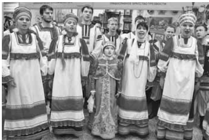
Выступает фольклорный коллектив «Задоринка».

В районе работают 579 кружков, любительских объединений и самодеятельных коллективов, в которых занимаются 9189 человек, из них 60% – дети. Ежегодно в районе проводится более 2400 массовых мероприятий, в 2009 г. их посетило около 450 тыс. человек.