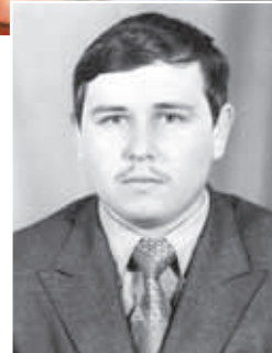
В студенческие годы.

А пожелать ему хочется хорошей работы в эти непростые для строительной отрасли времена и ещё, сохранения его замечательного коллектива, в котором работают настоящие профессионалы.