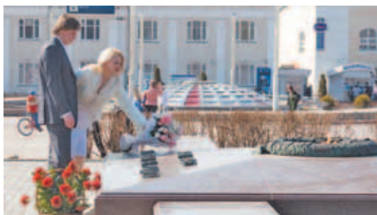
Старший сын с супругой у Вечного огня, построенного под руководством отца.

В это непростое для строительной отрасли время я хочу пожелать юбиляру дальнейшего развития, у нас впереди много планов, нового строительства. А ещё желаю здоровья и успехов ему и его близким.