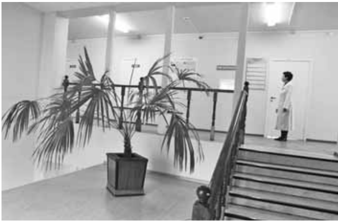
В Дмитровском противотуберкулезном диспансере.

ставительств вузов обучение ведётся в свободной форме, в дистанционной форме, в форме экстерната, проводится консультирование студентов.