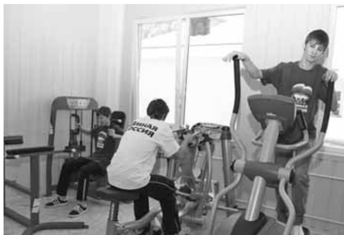
В тренажерном зале ФОК «Добрыня».

Статус районного имеют 10 конкурсов самодеятельного творчества, 21 самодеятельный коллектив имеет почетные звания «Народный» и «Образцовый». Ежегодно более 70 участников творческих коллективов и учащихся МОУ ДОД становятся лауреатами и призерами международных, областных и зональных конкурсов и фестивалей.