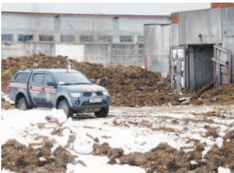
На ферме ОАО «Внуковское».

УПРАВЛЕНИЕ ПО ВОПРОСАМ БЕЗОПАСНОСТИ НАСЕЛЕНИЯ И МОБИЛИЗАЦИОННОЙ РАБОТЕ АДМИНИСТРАЦИИ РАЙОНА И ТОО РОСПОТРЕБНАДЗОРА МО ПО ДМИТРОВСКОМУ, ТАЛДОМСКОМУ РАЙОНАМ И Г. ДУБНА ПРОВЕРИЛИ ГОТОВНОСТЬ СЕЛЬСКОХОЗЯЙСТВЕННЫХ ПРЕДПРИЯТИЙ К ПАВОДЬЮ